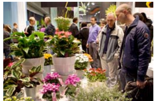
Aandacht voor de noviteiten op de beurs.